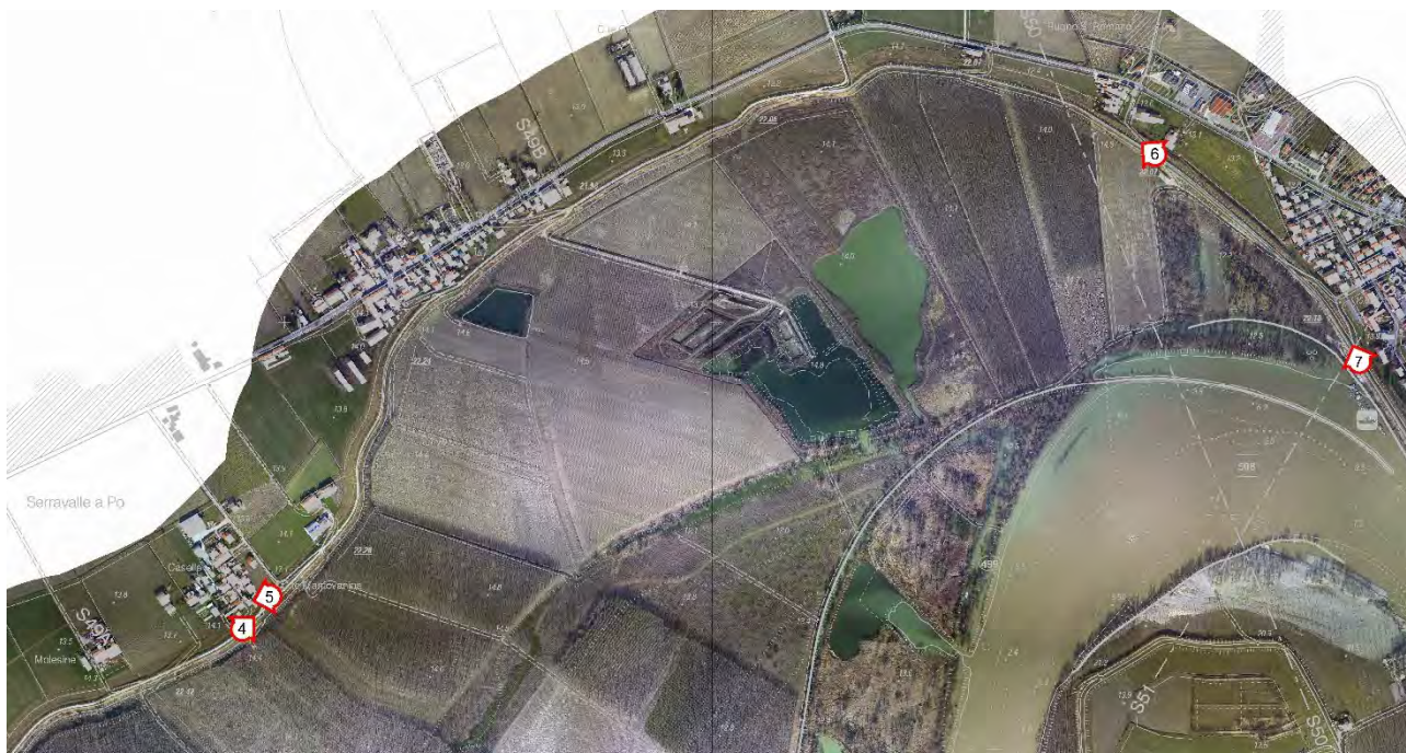
Planimetria tratto Serravalle a Po – Ostiglia con indicazione dei punti di ripresa fotografici