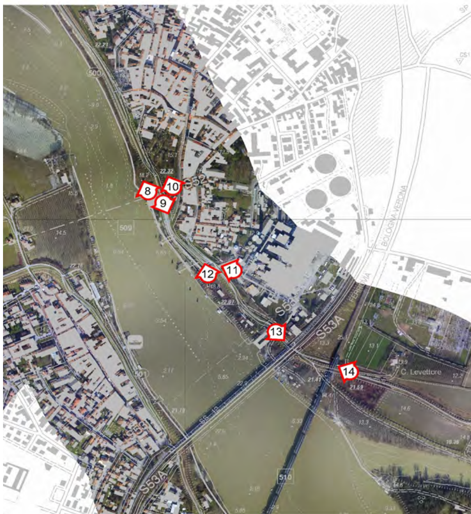
Planimetria zona Ostiglia con indicazione dei punti di ripresa fotografici